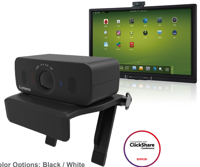
Color Options: Black / White