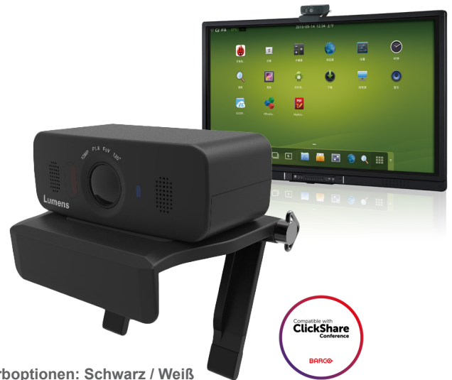
Farboptionen: Schwarz / Weiß

Kompatibel mit allen beliebten Applikationen und Cloud-Systemen: